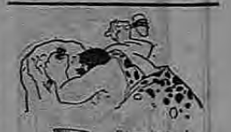
Esta serpiente es el resultado de la desinfección por su fuerza.

Has gentes se han resistido a todas las innovaciones sanitarias modernas y la higiene va a clausurar esos establecimientos dado que la ley ha de ser preja para todos y que los propietarios complidos han hecho gastos muy fuertes.